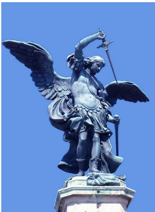
Peter Anton von Verschaffelt, L'arcangelo Michele rinfodera la spada , statua di bronzo sulla cima di Castel Sant'Angelo a Roma, 1753. The Archangel Michael sheathing his sword , bronze, pinnacle of Castel Sant'Angelo, Rome, 1753. L'archange saint-Michel rengaine son épée , bronze, Rome, faite du Château Saint-Ange, Rome, 1753

La pandémie actuelle, qui bouleverse les habitudes et les certitudes de nos contemporains, stimule recherches et réflexions sur les épidémies du passé mais aussi sur celles plus récentes : non seulement la peste qui a frappé les villes médiévales et celles de l'Époque moderne, mais également le typhus, la grippe espagnole qui ont ravagé les populations aux XIX e et XX e siècles. La Società romana di storia patria a l'intention de consacrer une importante partie monographique d'une prochaine livraison de l'«Archivio» au thème «Temps d'épidémie» afin d'analyser l'impact historique de ces événements. On tiendra compte des propositions qui relient ce thème avec «Rome» (au sens