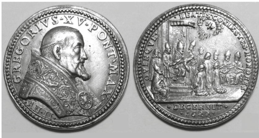
Fig. 6 - Giacomo Antonio Moro, Médaille de la canonisation, 1622.

L'apparat auto-célébratif est instrumentalisé au profit des politiques et de la propagande. Un patrimoine de mémoire est créé, composé de textes et d'images, avec l'étendard, les peintures des médailles et les tableaux de canonisation suscitant de nombreuses images sérielles, estampes et peintures.