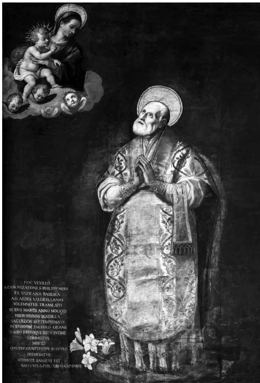
Fig. 7 - Étendard de Saint Philippe Neri, Archivio degli Oratoriani, livre de Bacci.