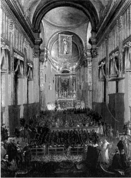
Fig. 8 - Andrea Sacchi, Chiesa Nova lors de la célébration pour la canonisation de Philippe Neri, 1622, peinture.

sont réalisées dans la ville, encouragées surtout par les ordres nouveaux, ce qui redessine le tissu urbain : les Jésuites construisent le complexe dédié à saint Ignace et celui du Collegio Romano, les Oratoriens font l'Oratoire dessiné par Francesco Borromini, flanquant le couvent, la bibliothèque et l'actuelle Chiesa Nuova avec la vaste place devant. Sur décision d'un groupe de franciscains espagnols venus à Rome à l'occasion de la canonisation d'Isidore, l'église Saint'Isidore de Capo le Case est construite de 1622 à 1630 par Andrea Cassoni ; dédiée au saint, elle est consacrée en 1686 ; un retable représentant