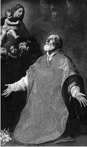
Fig. 1 - Guido Reni, Vision de la Madone par Philippe Neri, 1614, peinture, Vallicella.