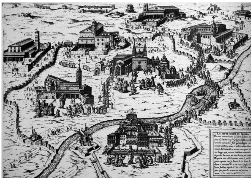
Fig. 2 - Antonio Lafréry, Les Sept Eglises de Rome, 1575, la ville est réduite à l'itinéraire, estampe.