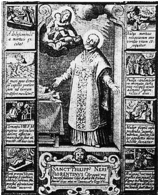
Fig. 5 - Vignette de Philippe Neri, détail de la gravure de Matteo Greuter, 1622.